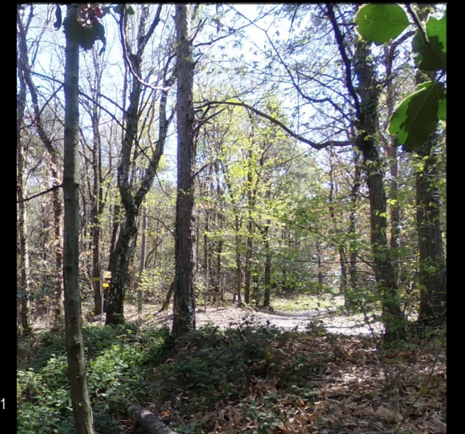
immagine 1 https://www.fi.ch/resultate/photos/thumbnails-it.php?reg=2262%3B5250 Chiasso TI, 17.04.2023